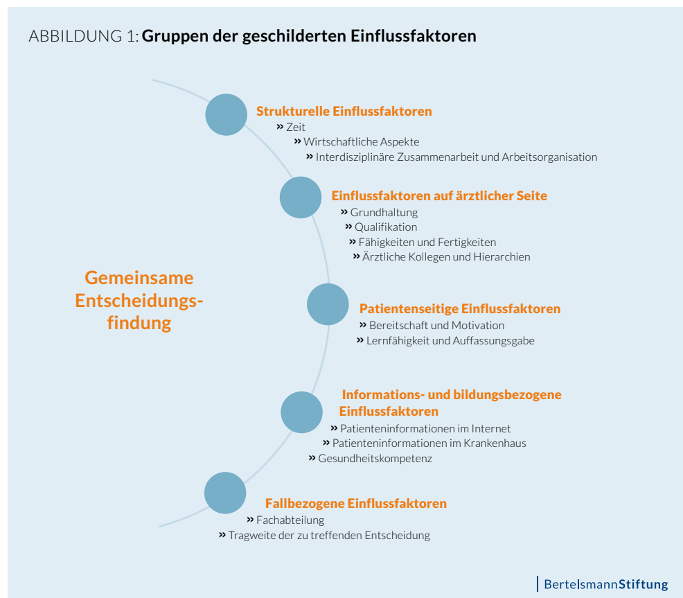
ABBILDUNG 1: Gruppen der geschilderten Einflussfaktoren

Die Umsetzbarkeit des Ansatzes im Klinikalltag wird den teilnehmenden Ärzten zufolge von einer Reihe ganz unterschiedlicher Einflussfaktoren bestimmt. In beiden Diskussionen ließen sich aus den Beiträgen fünf Gruppen bzw. Cluster herausarbeiten (vgl. Abbildung 1). Ein Themencluster ließ sich dem Einflussbereich der Ärzteschaft zuordnen, ein zweiter