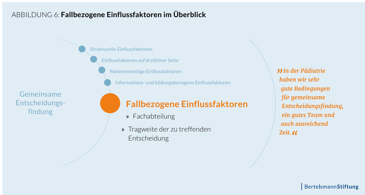
ABBILDUNG 6: Fallbezogene Einflussfaktoren im Überblick